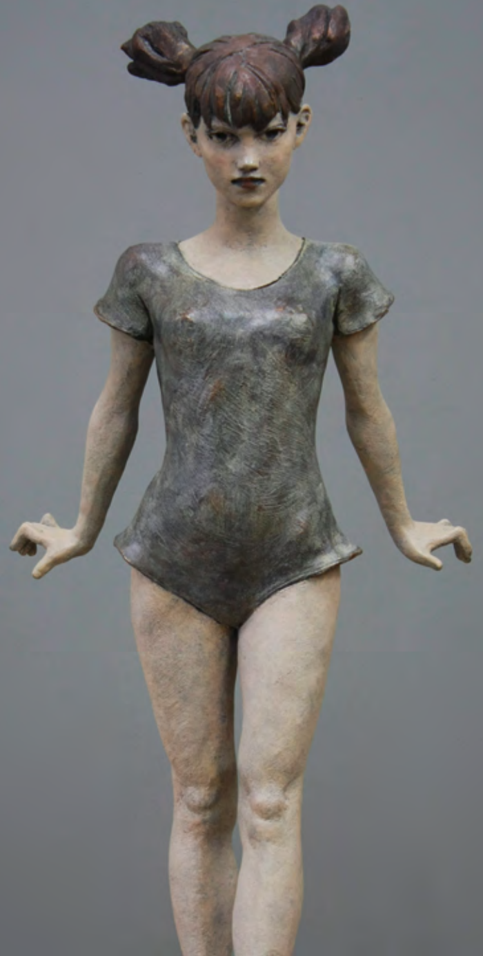
Der Auftritt | 2010 | Bronze