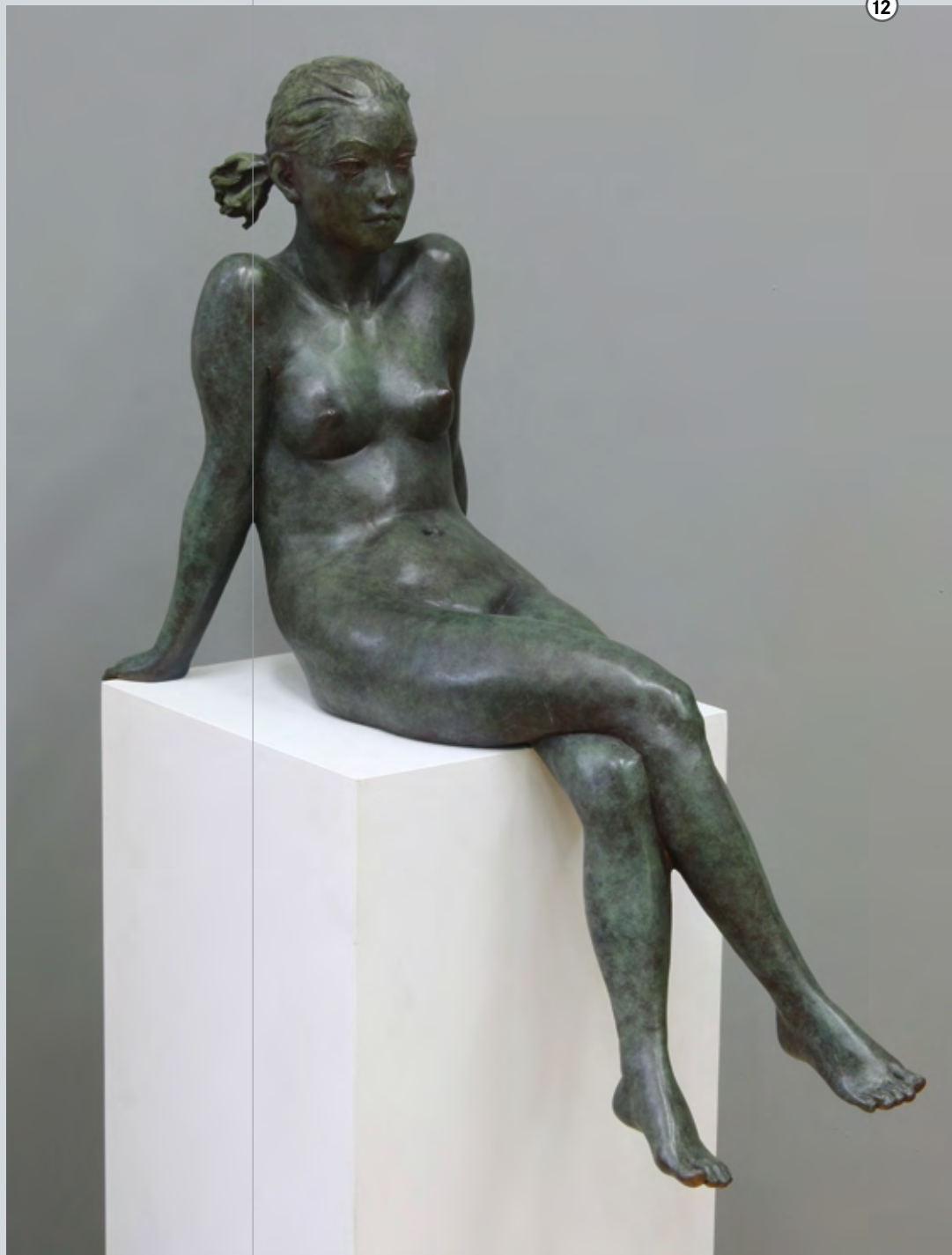
Sonntagmorgen | 2011 | Bronze