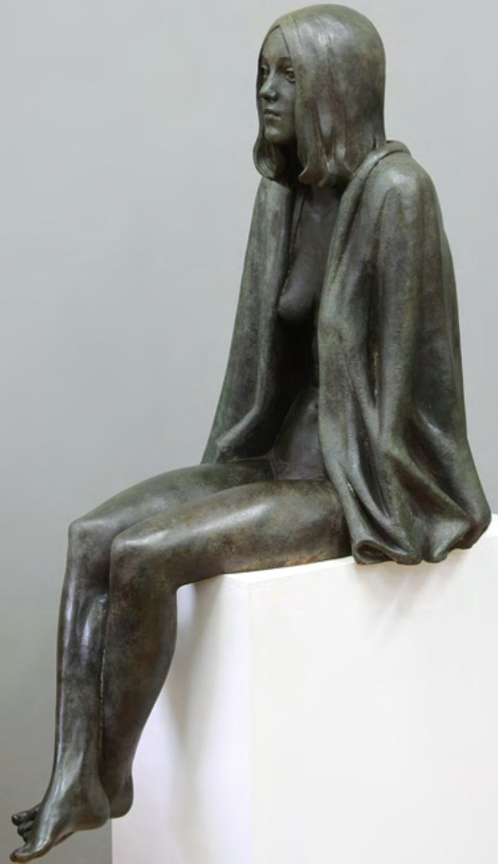
Sitzende mit Handtuch | 2016 | Bronze