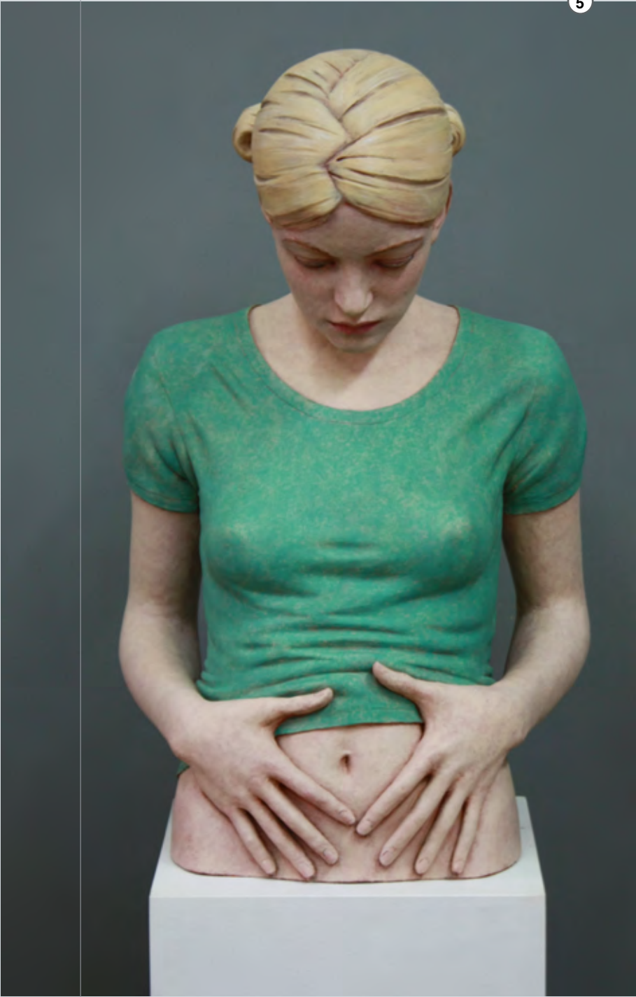
Nabelschau | 2015 | Terracotta, Acrylfarbe