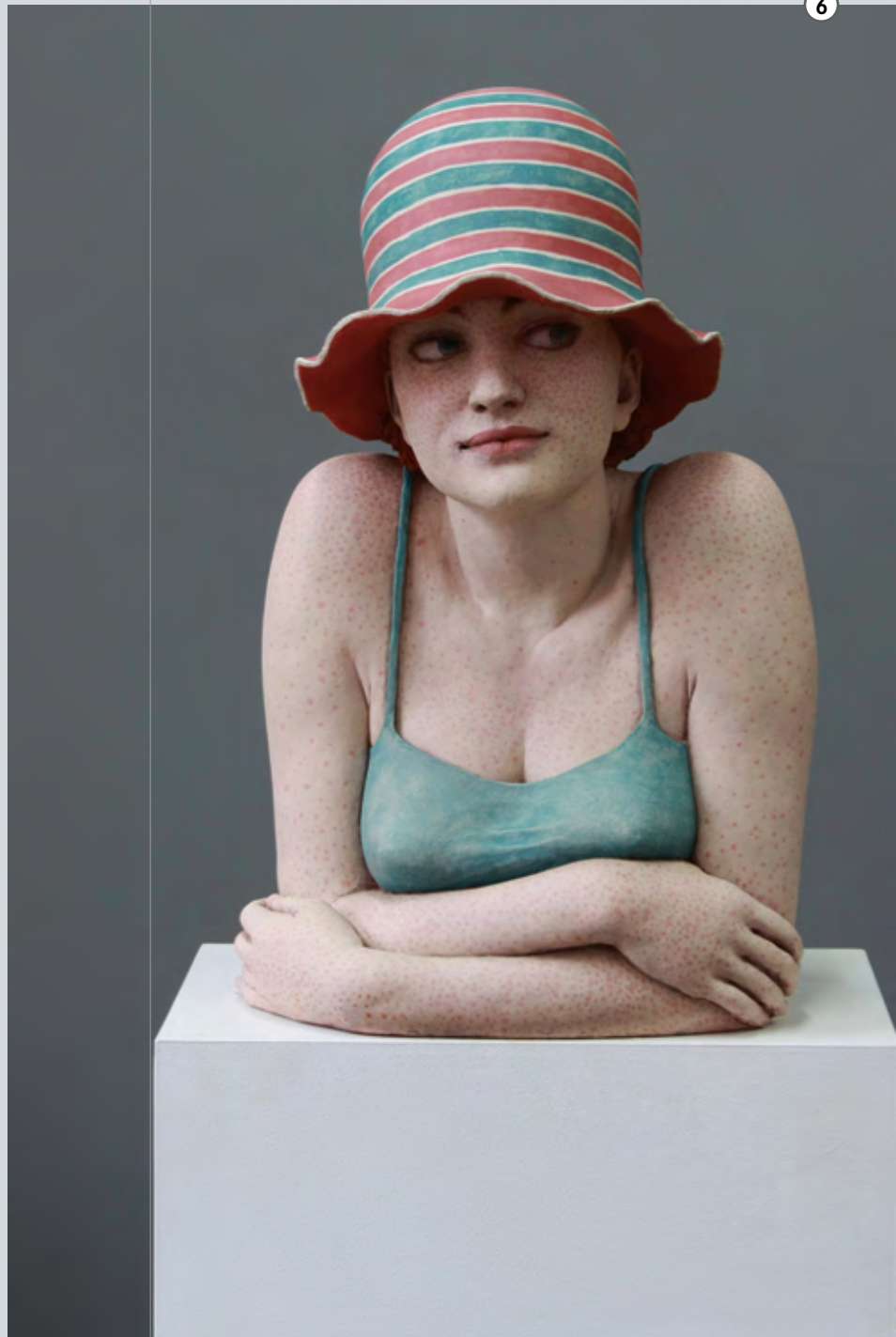
Sommer | 2016 | Terracotta, Acrylfarbe