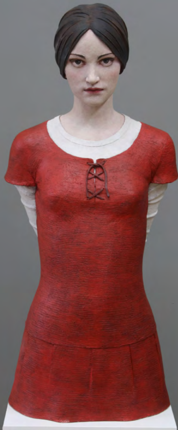
Spieglein, Spieglein | 2014 | Terracotta, Acrylfarbe