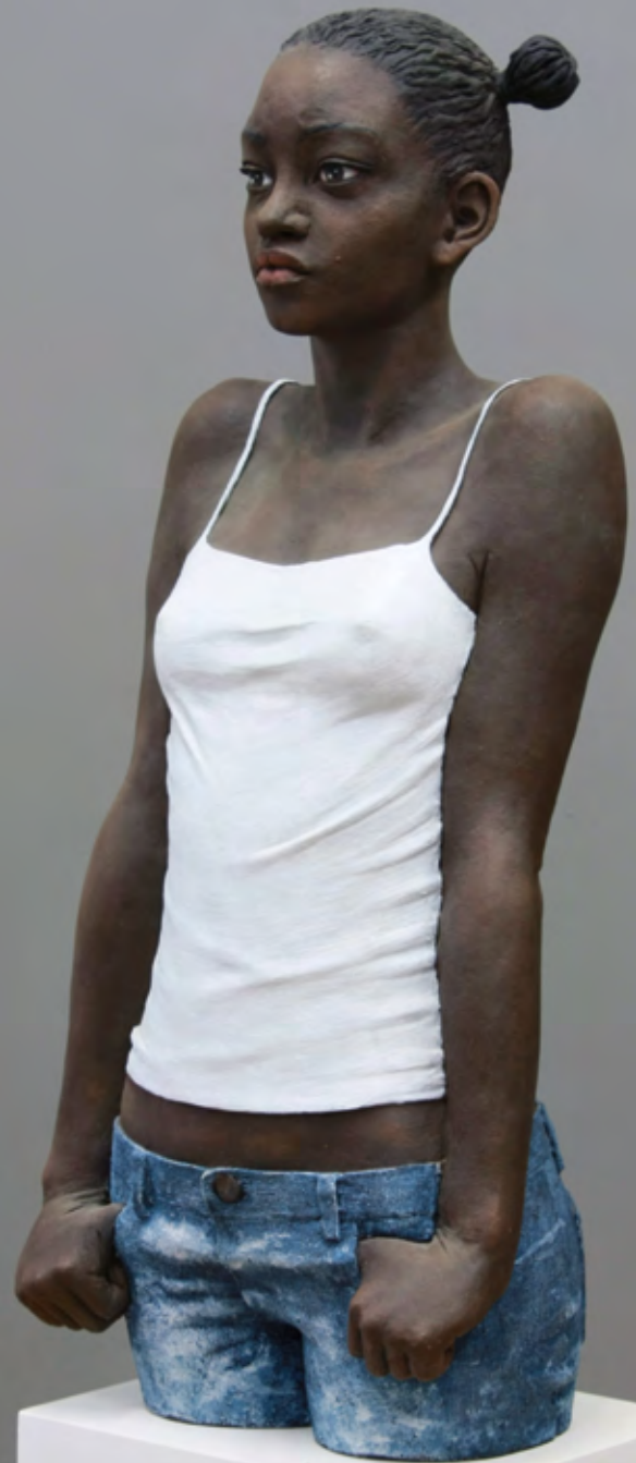
Bittersweet | 2011 | Terracotta, Acrylfarbe