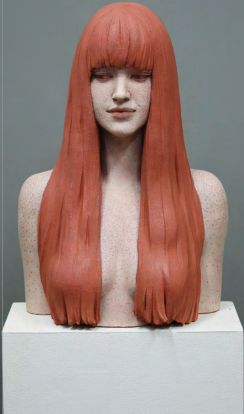
Deine Sommersprossen | 2015 | Terracotta, Acrylfarbe