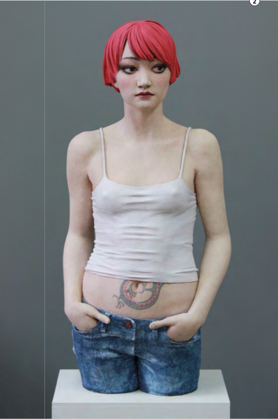
Dragon girl | 2010 | Terracotta, Acrylfarbe