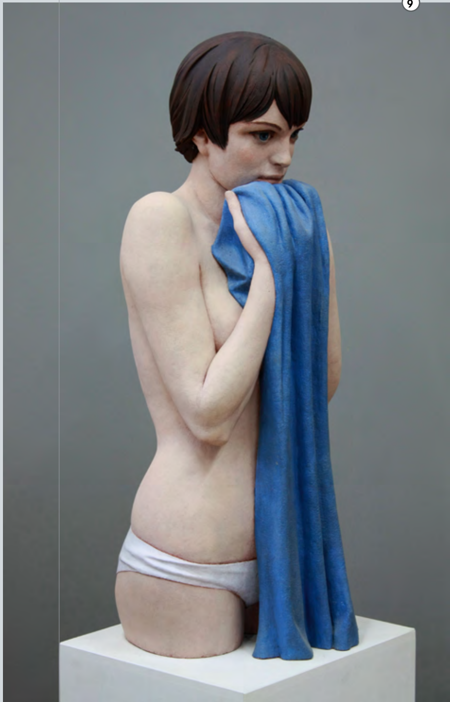
Tagträumen | 2011 | Terracotta, Acrylfarbe