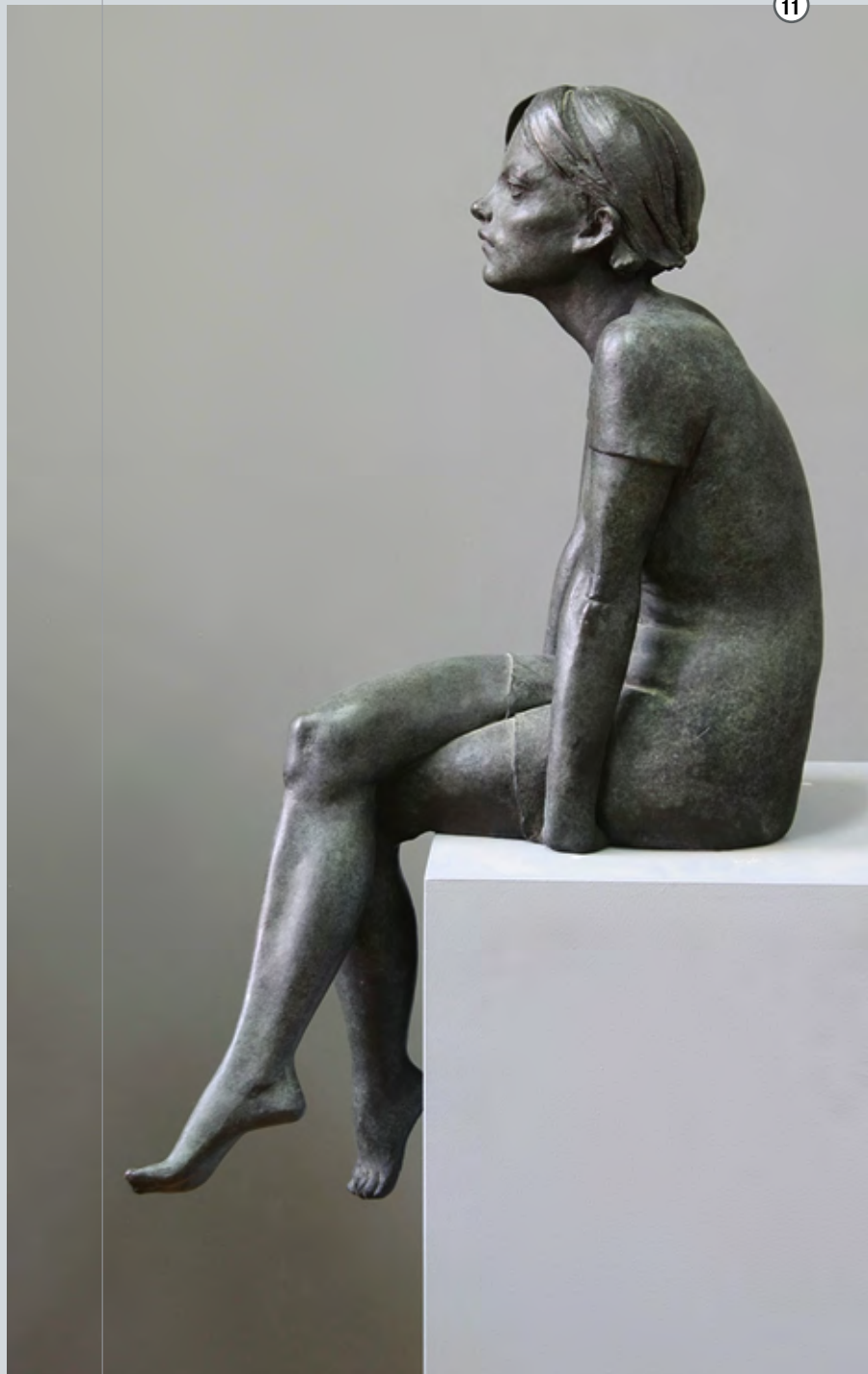
Sonntagnachmittag | 2008 | Bronze