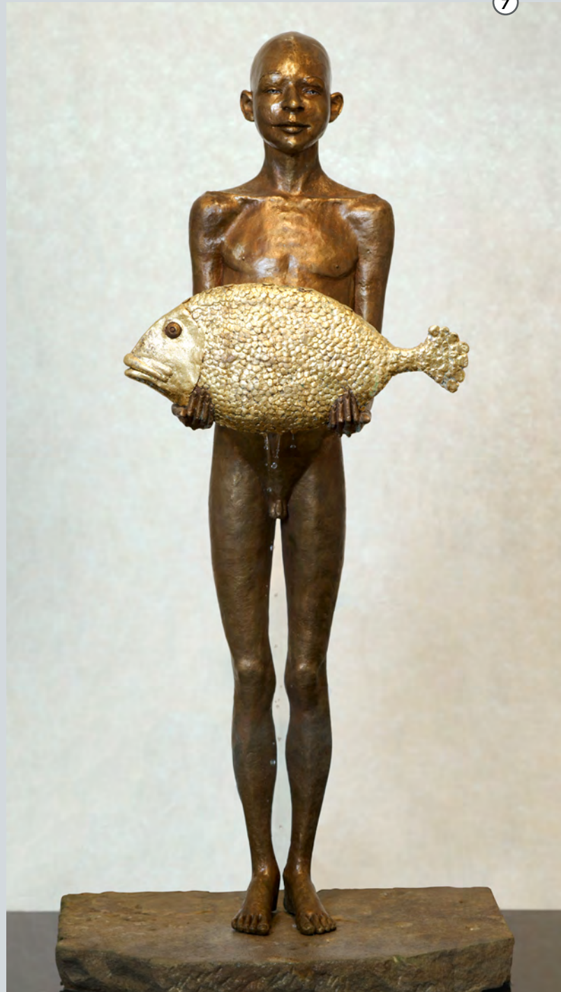
Goldfisch | 2004 | Bronze