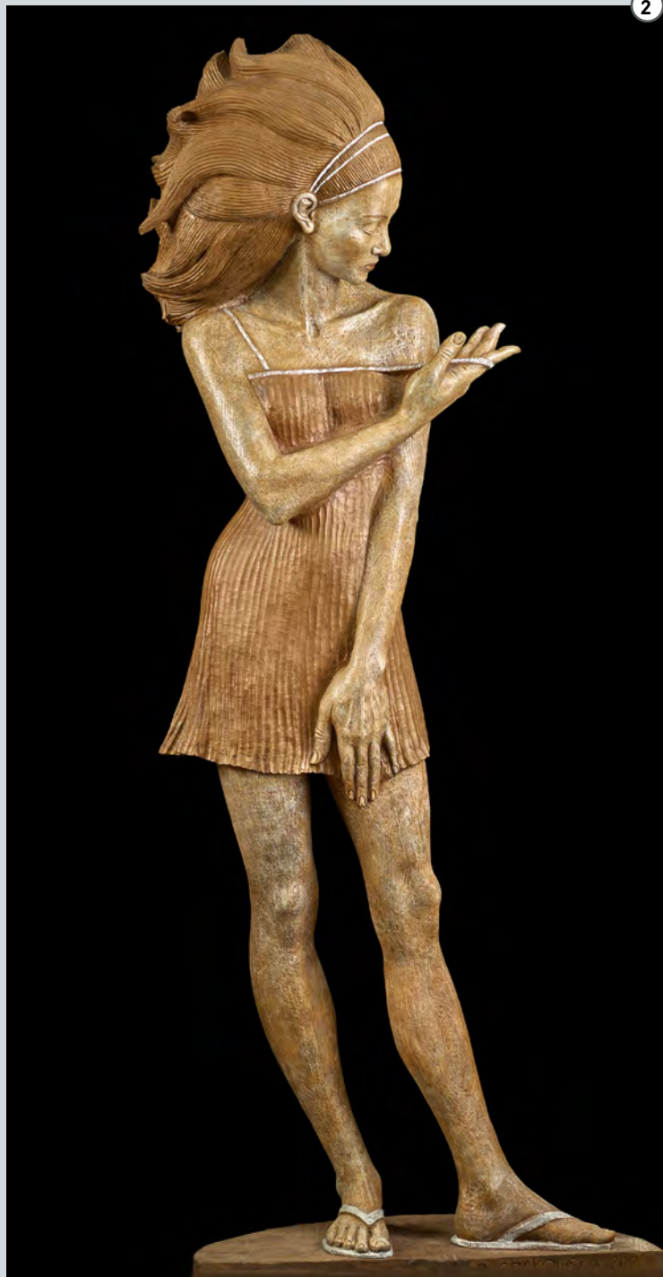
Nora | 2012 | Bronze