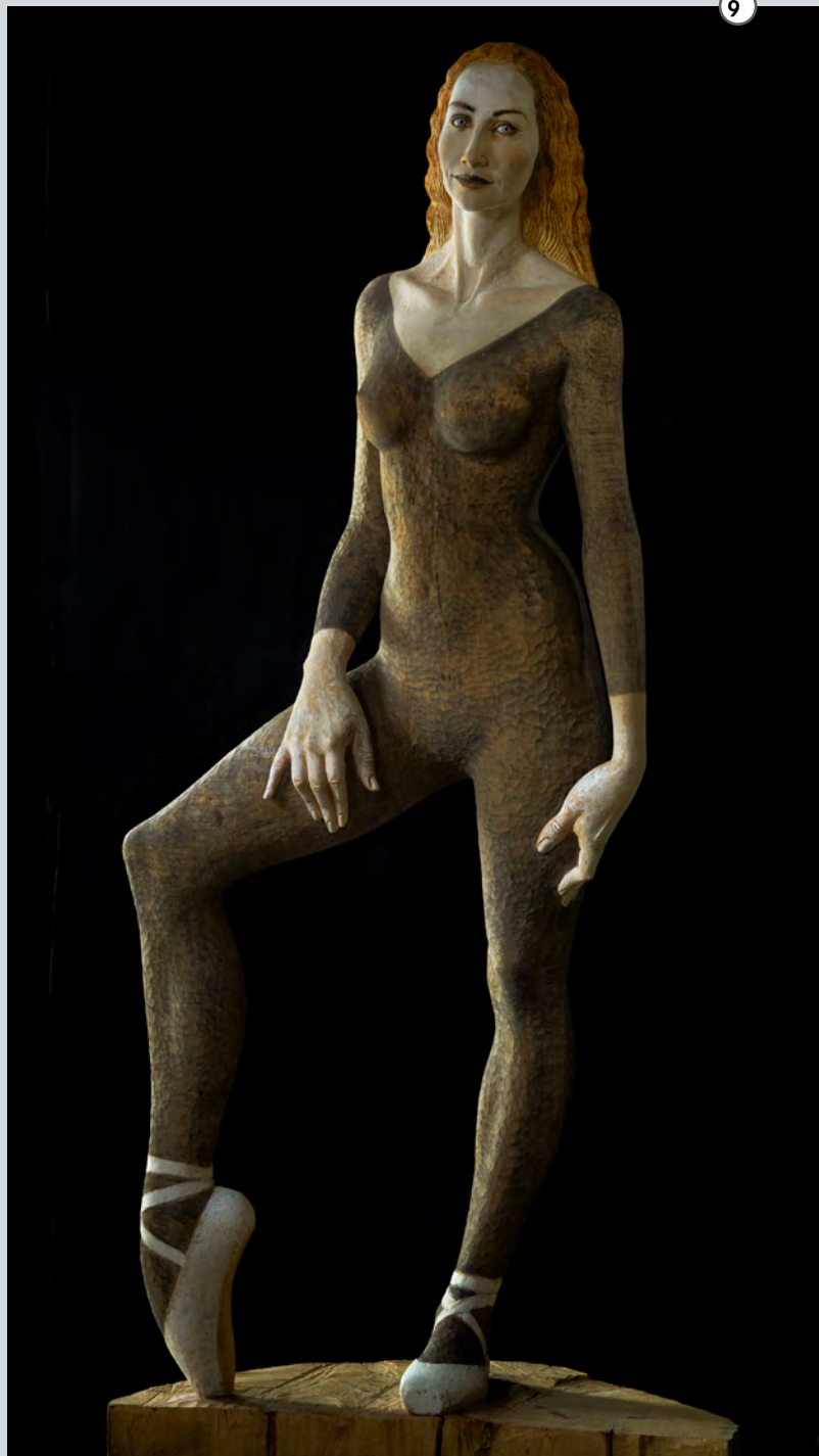
Jana | 2013 | Bronze