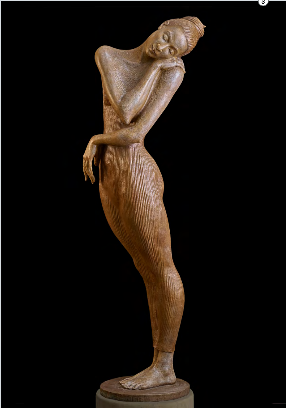
Bella Figura | 2015 | Bronze