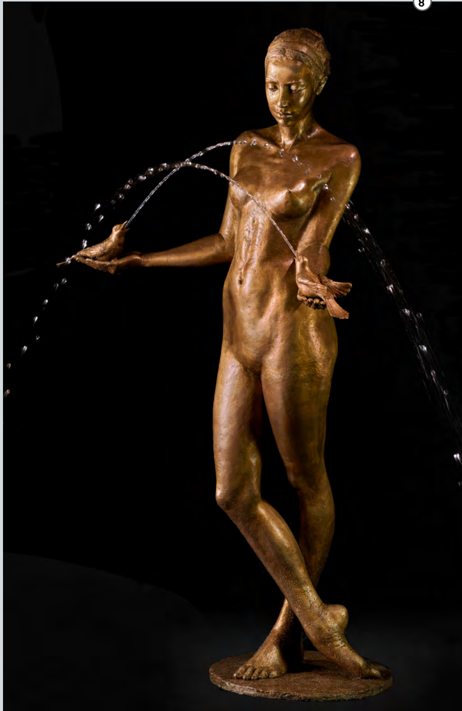
Vogelhochzeit | 2017 | Bronze