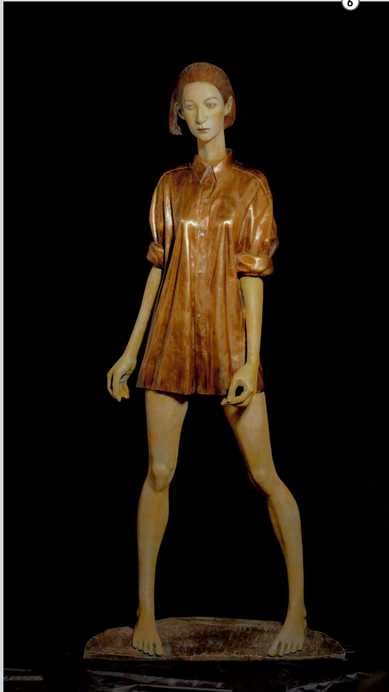
Frau mit Hemd | 2010 | Bronze