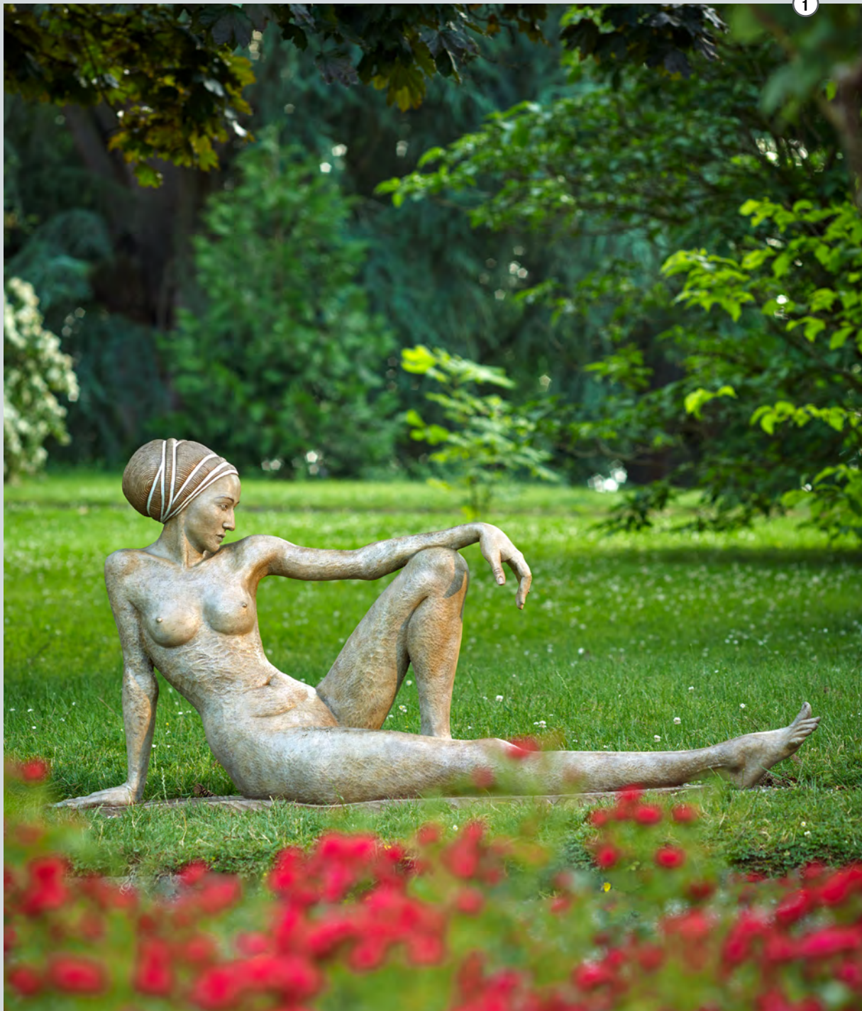
Apolonia | 2009 | Bronze